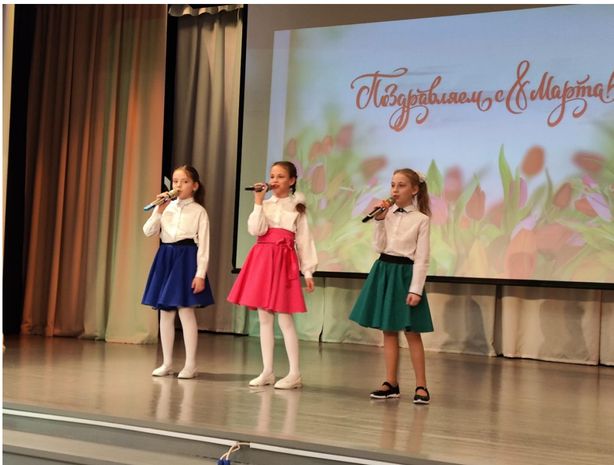
Александра участвует в поздравительном номере