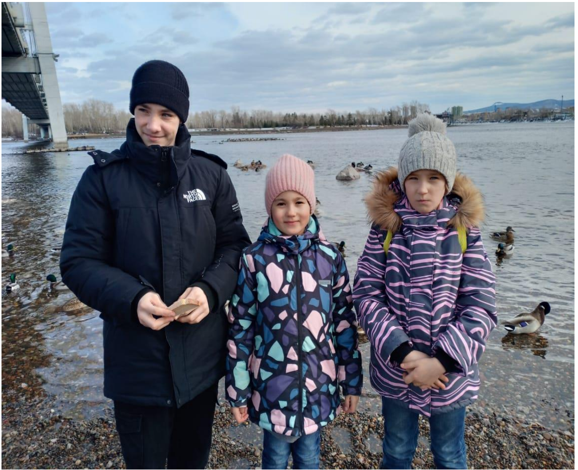
Кормим уток на Енисее