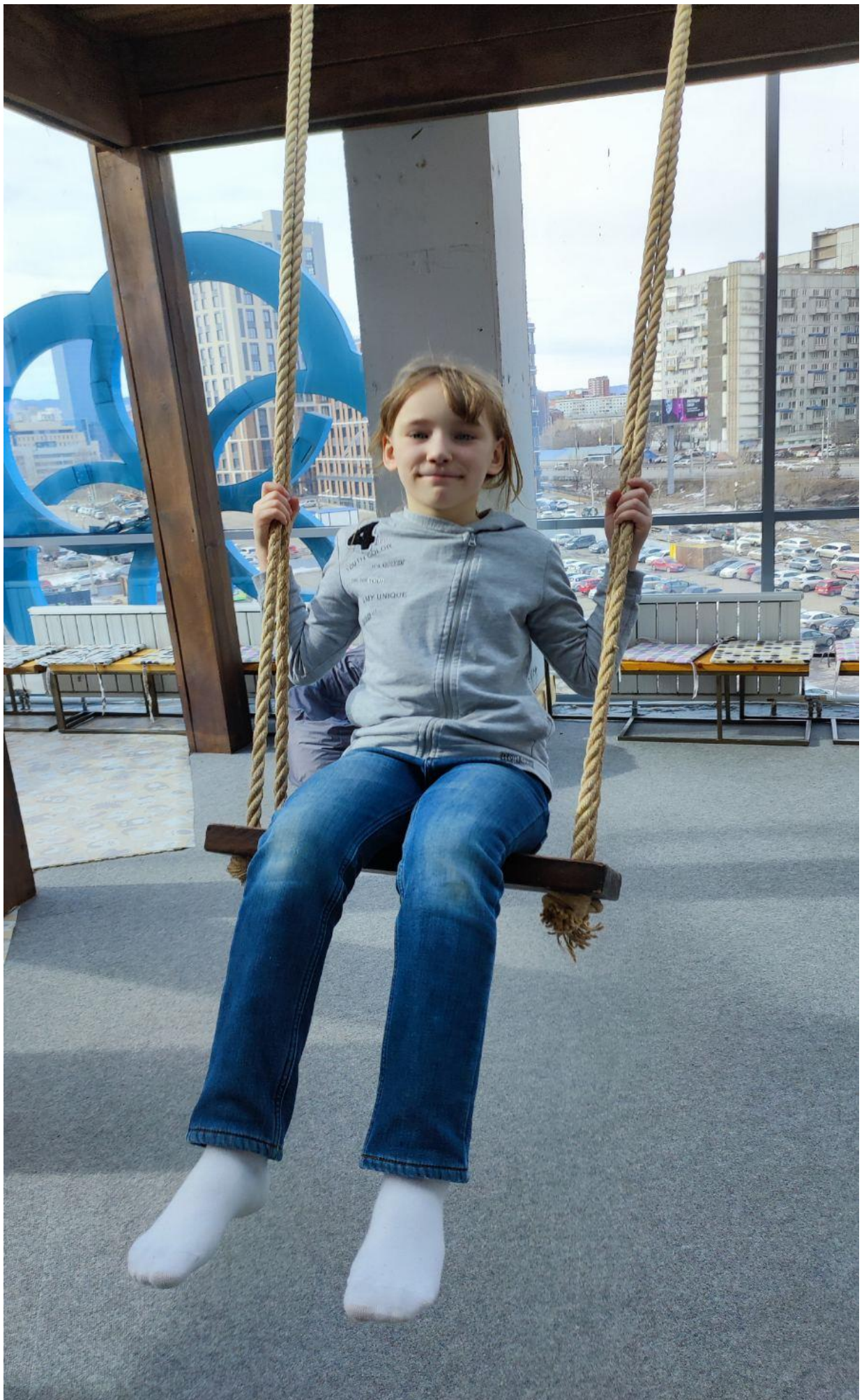
Крылатые качели ☺