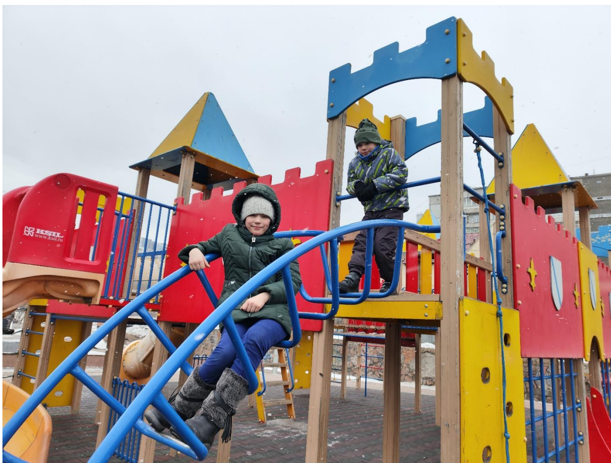
«Сказочный городок». Знакомим новых воспитанников с ним