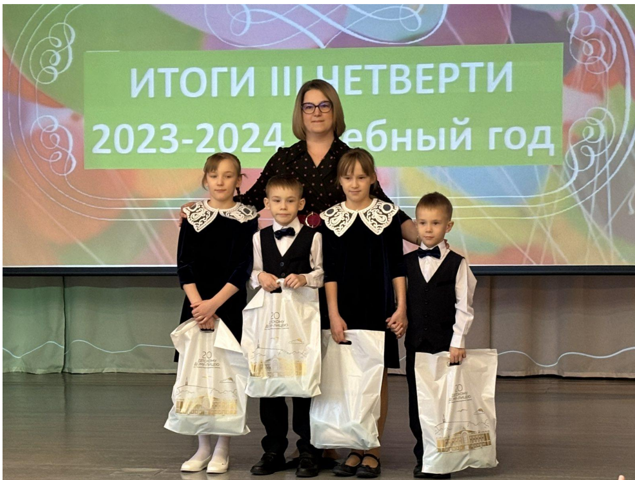
Принимаем в лицеисты новых ребят