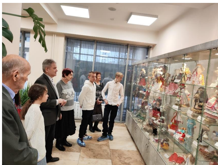
Выставка игрушек, выполненных в народных техниках