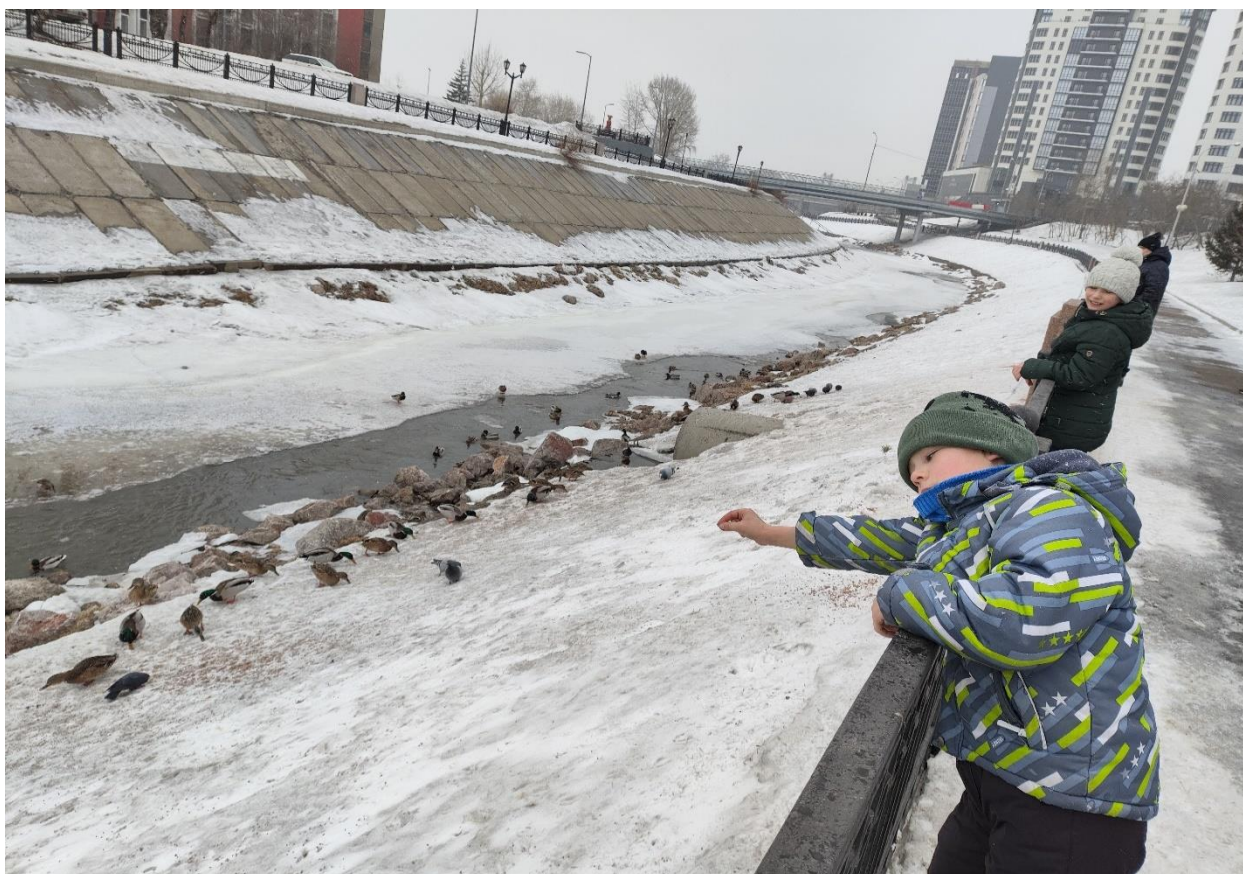
Любимые уточки на р. Кача. Привыкли, что мы их всегда кормим. Уже ждут