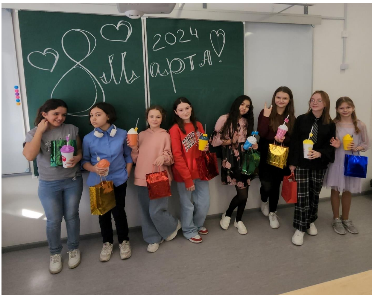
Поздравляем учителей в школе