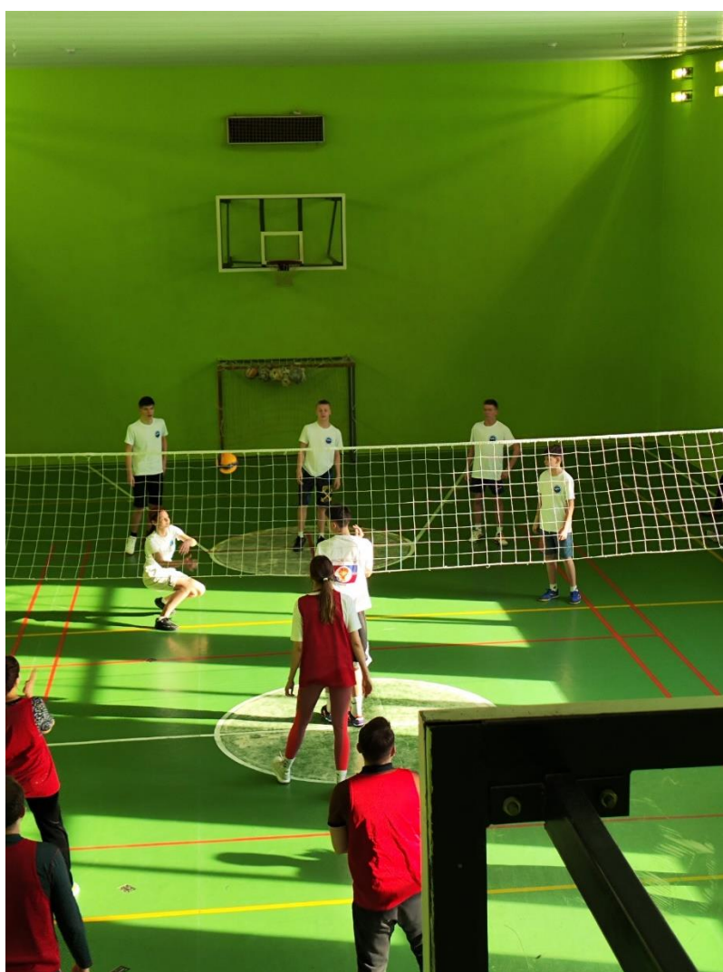
Товарищеский матч с работниками прокуратуры