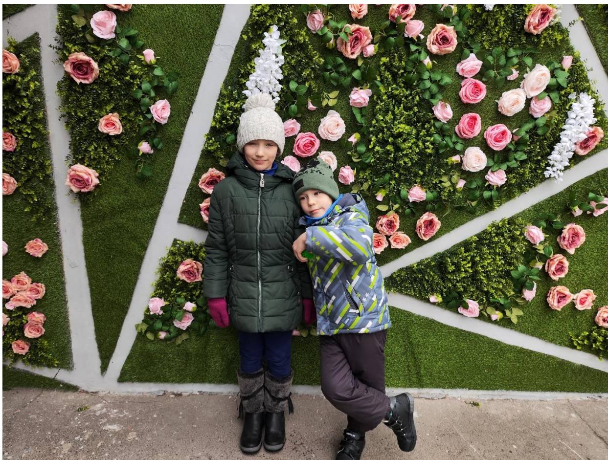
Вот такой красивый подземный переход преобразили около нас