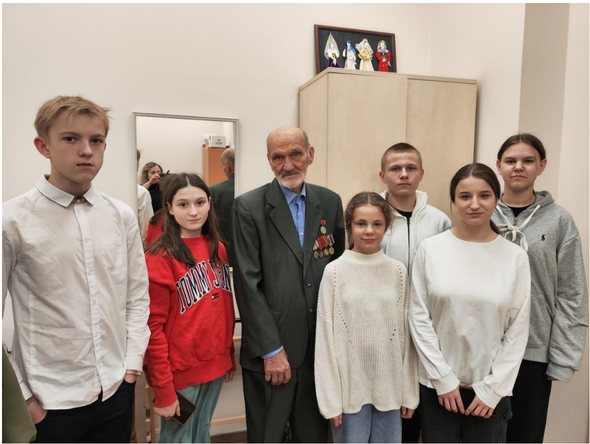
Выезд с нашими дедушками и бабушками из клуба бывших узников фашистских концлагерей «Жизнь и Судьба» на мастер-класс в Дом дружбы народов. День эстонской культуры.