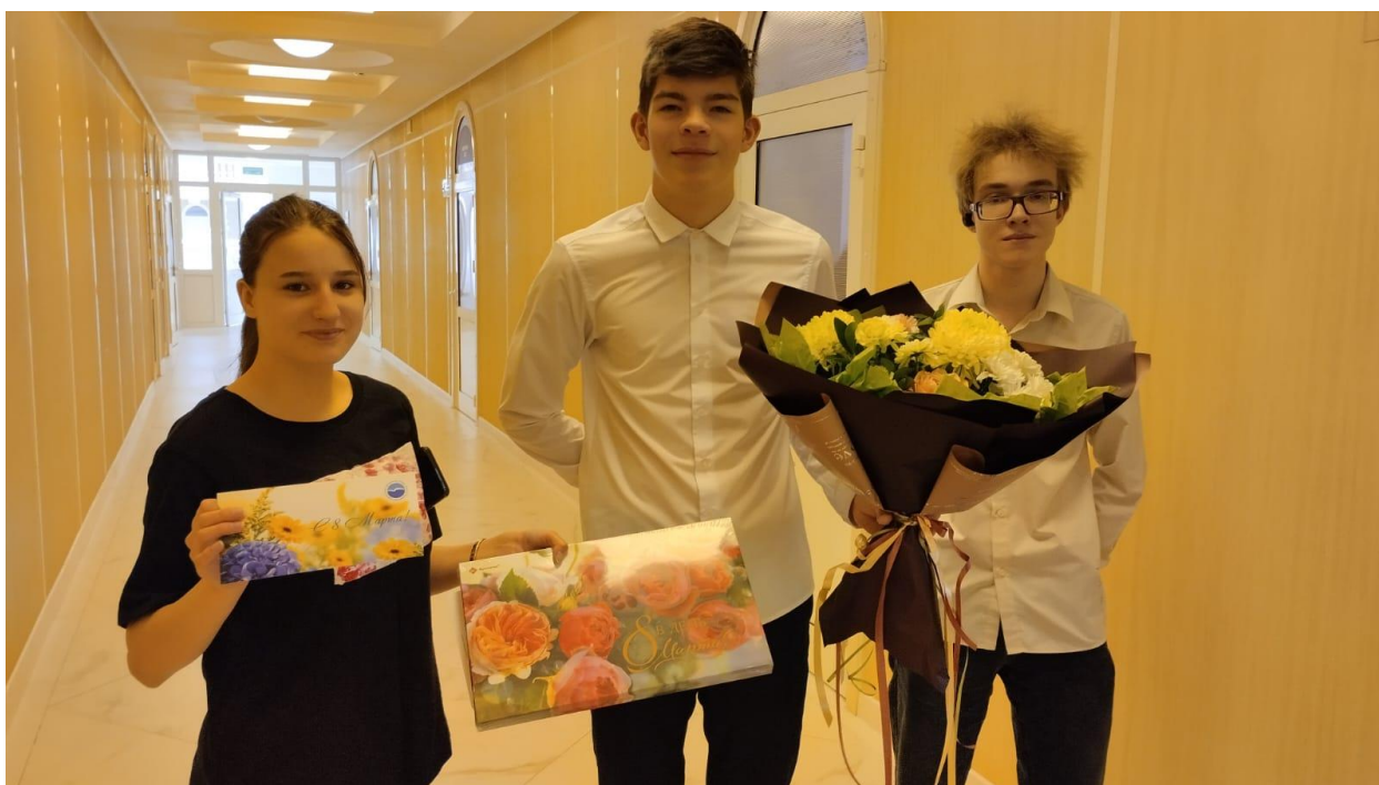
Поздравляем нашего чудесного преподавателя по русскому языку