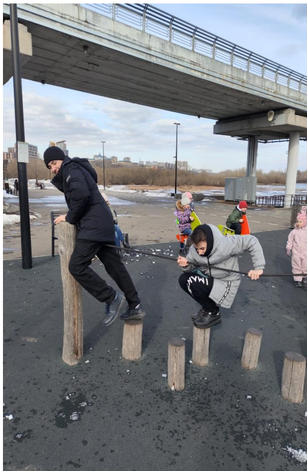
Заодно активно отдыхаем