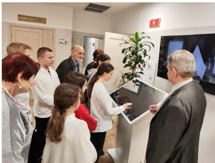
Посещение интерактивного музея