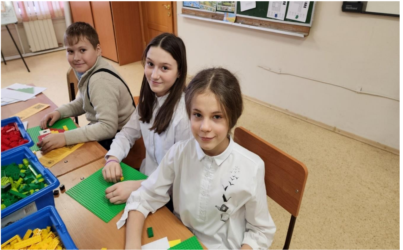
Немного учебы ☺