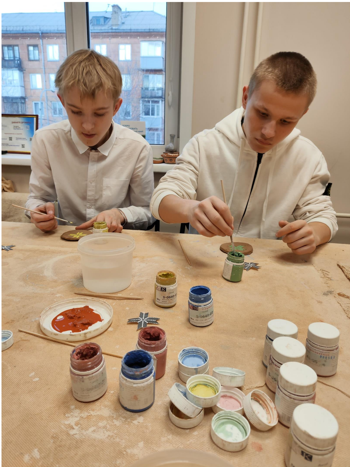
Мальчики в работе