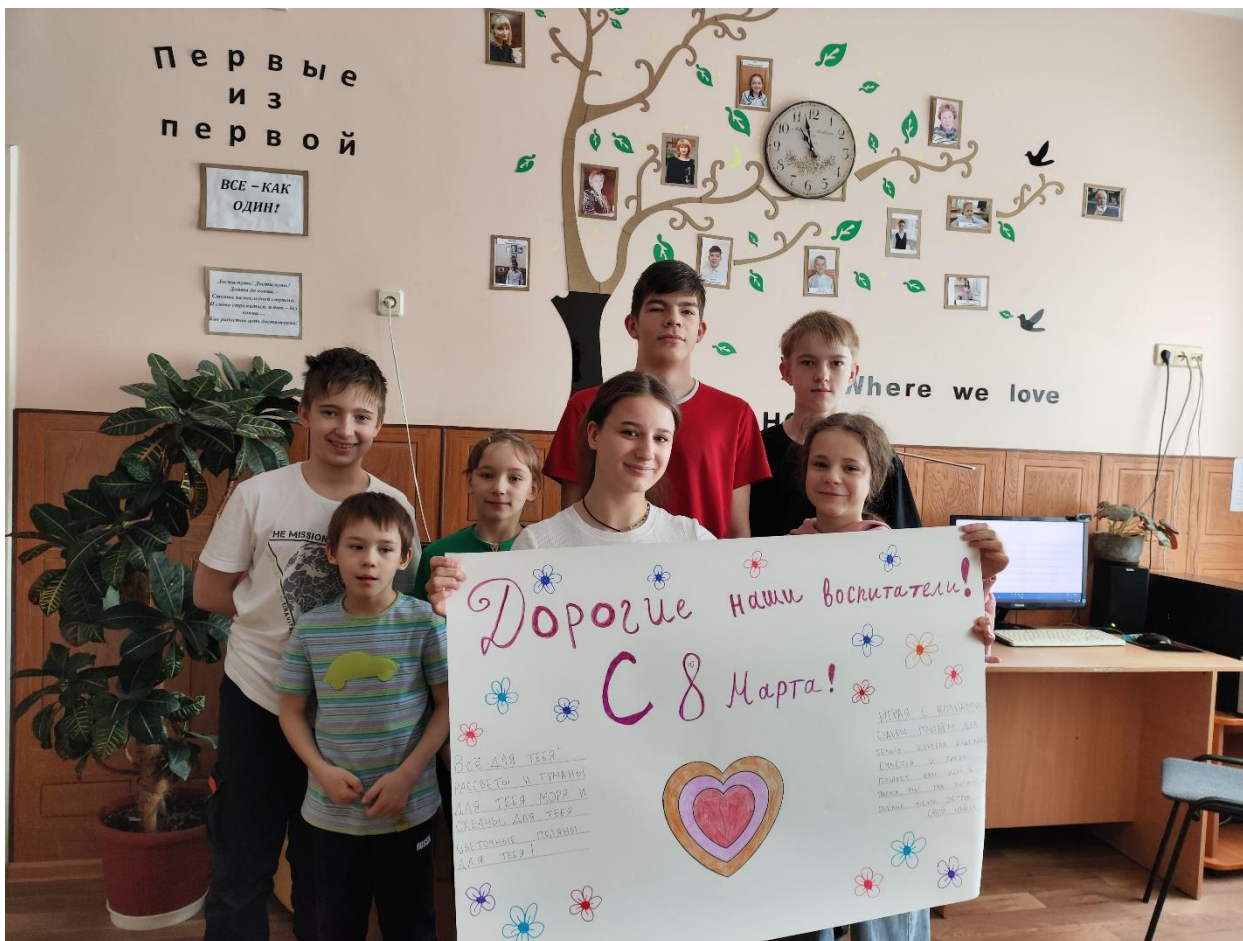
Поздравляем наших мамочек-воспитателей