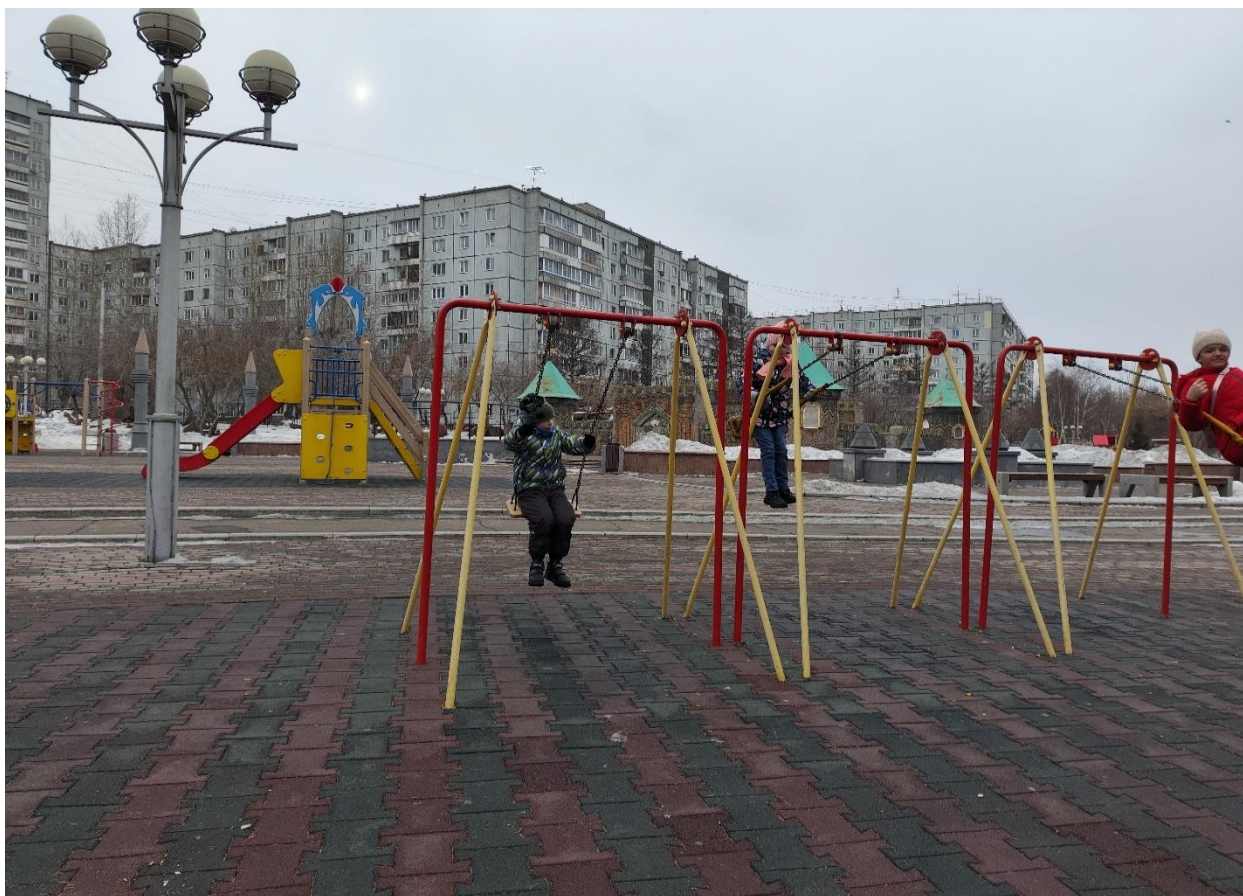
Варя и Вася на прогулке